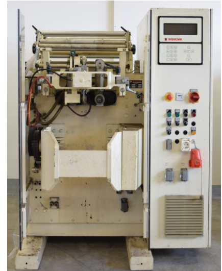
ROVEMA VPR 250 vorher

→ Preis je nach Maschine, Baujahr und Ausstattung → Ausstattung mit Applikationen gemäß Kundenwunsch